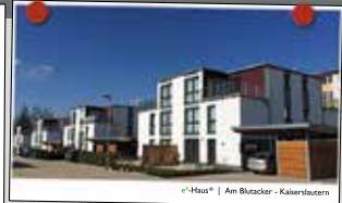
e-Haus® | Am Bluetzer - Kaiserslautern

Wir schaffen bezahlbaren Wohnraum in guten Lagen. Unser Ziel ist es, mittels moderner Architektur eine sinnvolle städtebauliche Nachverdichtung zu erreichen.