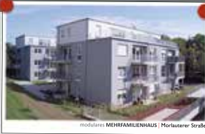
modulares MEHRFAMILIENHAUS | Morlauterer Straße