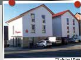
WEGEN-HORN | Pfälzer

Wir bauen für Sie marktgerechte Wohnimmobilien mit System. Unsere durchdachten und vielfach bewährten Raumkonzepte sind altersgerecht und rollstuhlfreundlich bei energieeffizienter Bauweise. Bei unseren Projekten stehen Preis & Leistung in Relation!