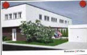
Illustration | H-Haus