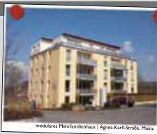
moderne Mehrfamilienhaus | Agnes-Karl-Straße, Mainz

Wohnen im Alter Wir bauen für Sie marktgerechte Wohnimmobilien mit System. Unsere durchdachten und vielfach bewährten Raumkonzepte sind altersgerecht und rollstuhlfreundlich bei energieeffizienter Bauweise. Bei unseren Projekten stehen Preis & Leistung in Relation!