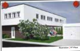
Illustration | HF-Horn

Verfügen Sie über Grundstücke in guter Lage?