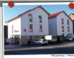
WEGEN-HORN | Metzau

Wohnen im Alter Wir bauen für Sie marktgerechte Wohnimmobilien mit System. Unsere durchdachten und vielfach bewährten Raumkonzepte sind altersgerecht und rollstuhlfreundlich bei energieeffizienter Bauweise. Bei unseren Projekten stehen Preis & Leistung in Relation!