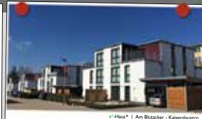
Am Blücker - Kaiserslautern

Junges Wohnen Wir schaffen bezahlbaren Wohnraum in guten Lagen. Unser Ziel ist es, mittels moderner Architektur eine sinnvolle städtebauliche Nachverdichtung zu erreichen.